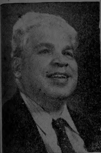
Melico Salazar Tenor nacional

Hoy está de duelo el arte nacional y el país ha perdido uno de sus hijos que le dieron fama mundial: el tenor Melico Salazar elevó su alma al Creador el domingo pasado.