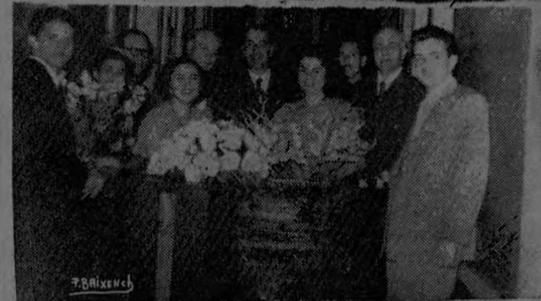
Dos aspectos de la fiesta

El sábado pasado celebramos el séptimo aniversario de vida de este periódico.