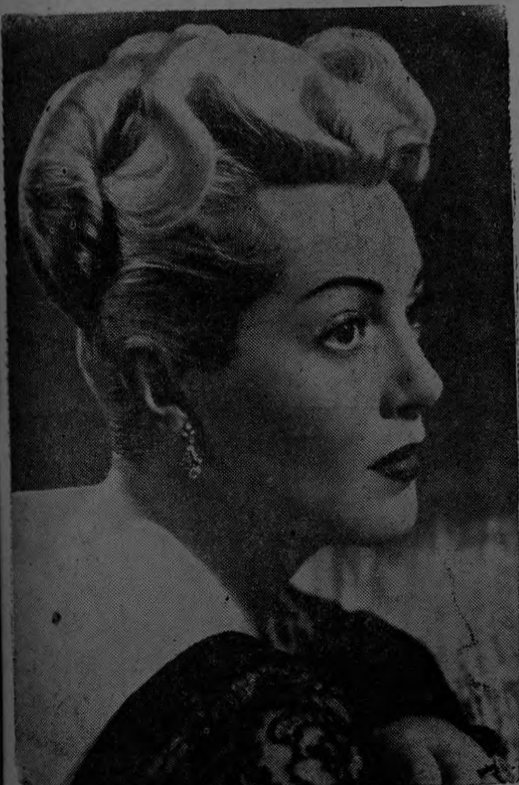
LANA TURNER... Estrella de la Metro Goldwyn Mayer

Con la distinguida interpretación de sus emotivos roles en "La Calle del Delfín Verde", "El Eterno Conflicto", "Resurrección" y "Los Tres Mosqueteros", Lana Turner alcan-